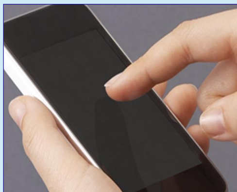
モバイル機器や腕時計のディスプレイ保護に