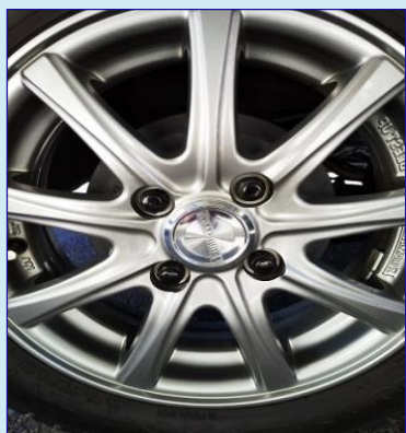
撥水ホイールコーティングとして