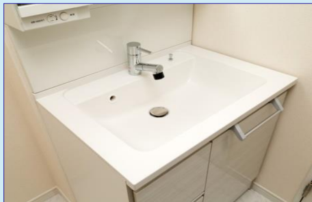
キッチンまわりや、洗面台の拭き掃除をしやすく